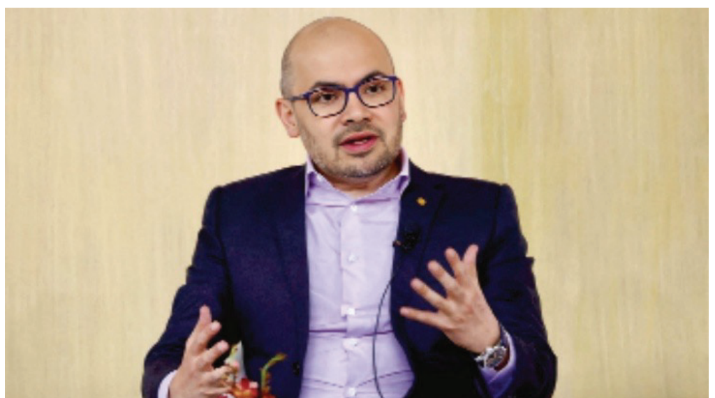
डेमिस हसाबिस का यह कदम स्वास्थ्य क्षेत्र में एआई क्रांति का प्रतीक है और निवेशकों को अगली पीढ़ी के हेल्थकेयर इनोवेशन में भाग लेने का अनूठा अवसर देता है।

यह घटना एआई-बायोटेक, फार्मास्यूटिकल्स, हेल्थटेक और लॉन्गेविटी सेक्टर के लिए बेहद सकारात्मक है। शेयर बाजार में गूगल (अल्फाबेट), टाटा एलेक्सी, बायोकॉन, सन फार्मा, डॉ. रेड्डी और अन्य इनोवेटिव हेल्थकेयर प्लेयर्स में सकारात्मक गति देखने को मिल सकती है। एआई-ड्रग डिस्कवरी से आने वाले 5-10 वर्षों में नई दवाओं की उपलब्धता बढ़ेगी, स्वास्थ्य लागत घटेगी और नई कंपनियों को यूनिकॉर्न बनने का मौका मिलेगा।